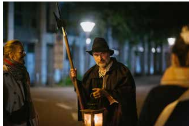
Event-Rundgang mit dem Nachtwächter