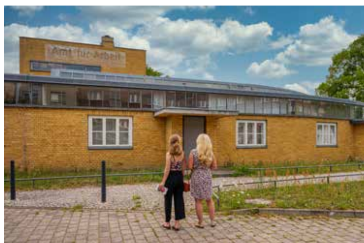
Das Historische Arbeitsamt