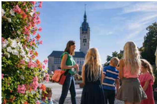
Stadtrundgang für Schulklassen