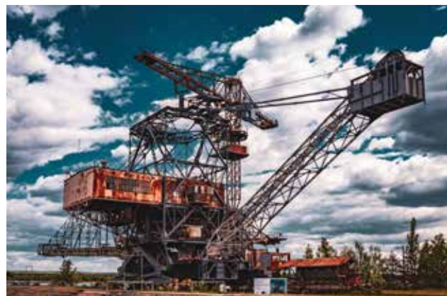
Einer der Braunkohlebagger in Ferropolis