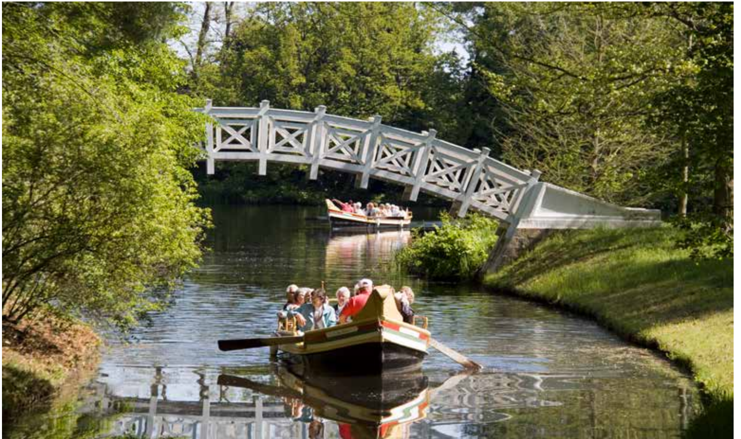
Eine Gondelfahrt im Wörlitzer Park