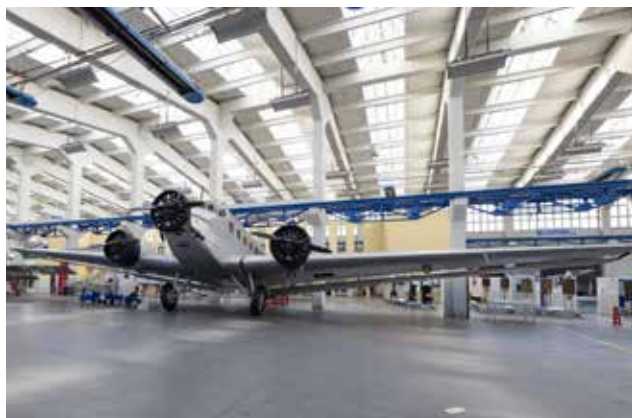
Eine originale JU 52 im Technikmuseum „Hugo Junkers“