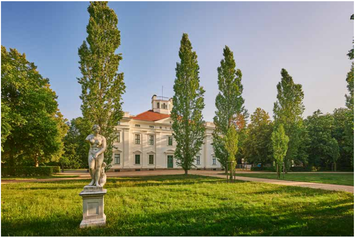
Schloss Georgium, Sitz der Anhaltischen Gemäldegalerie Dessau