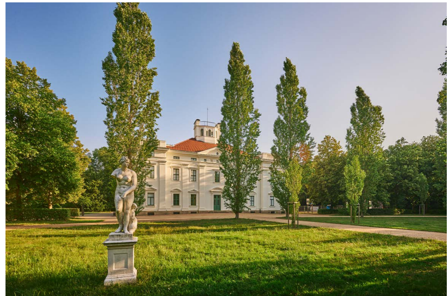
Schloss Georgium, Sitz der Anhaltischen Gemäldegalerie Dessau