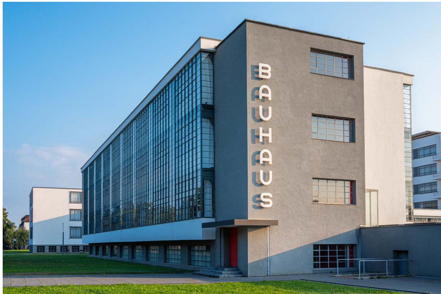
Ikone der Moderne: Das Bauhausgebäude in Dessau

Viel Freude beim Entdecken unserer vielfältigen Angebote. Für all Ihre Fragen stehen wir Ihnen gerne zur Verfügung. Wir freuen uns auf Ihren Besuch!