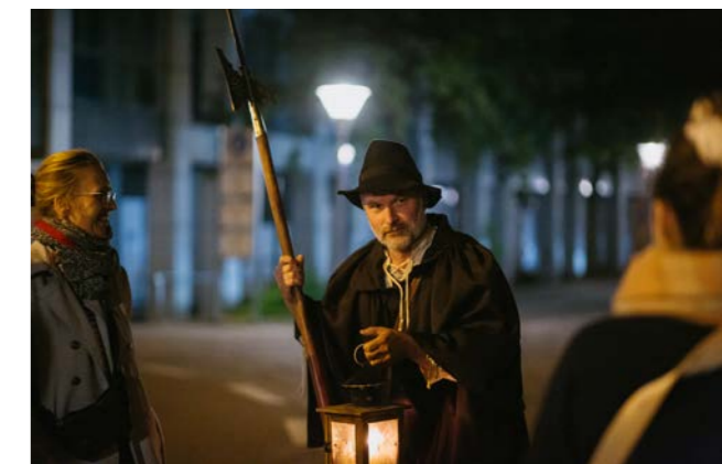
Event-Rundgang mit dem Nachtwächter