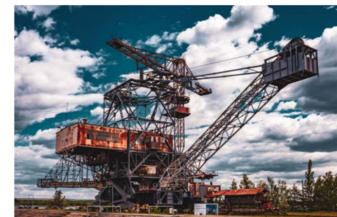
Einer der Braunkohlebagger in Ferropolis