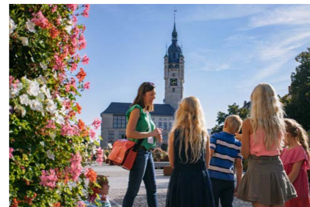
Stadtrundgang für Schulklassen