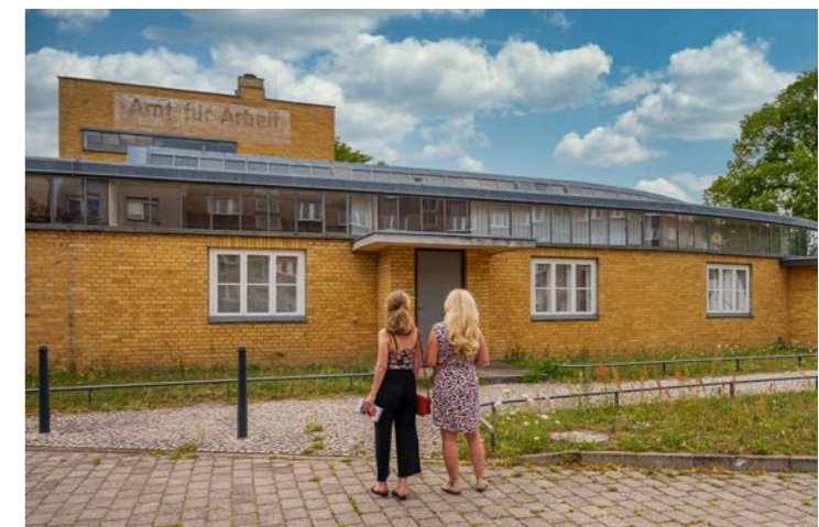
Das Historische Arbeitsamt