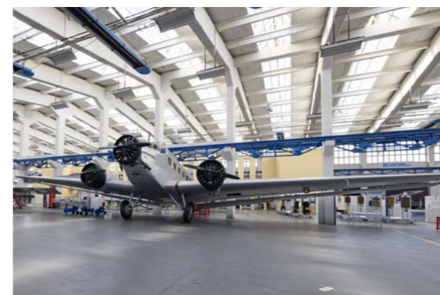
Eine originale JU 52 im Technikmuseum „Hugo Junkers“