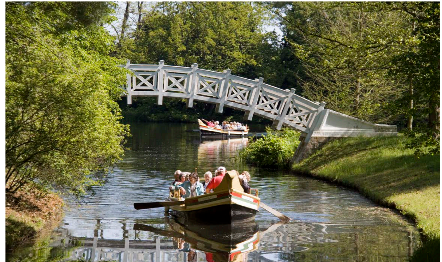
Eine Gondelfahrt im Wörlitzer Park