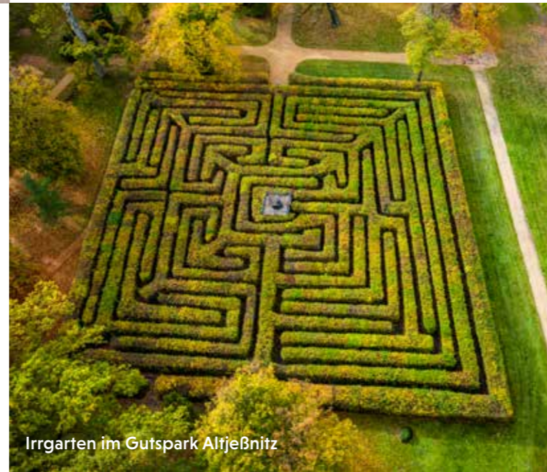
Irrgarten im Gutspark Altjeßnitz

Mehr erfahren anhalt-dessau-wittenberg.de