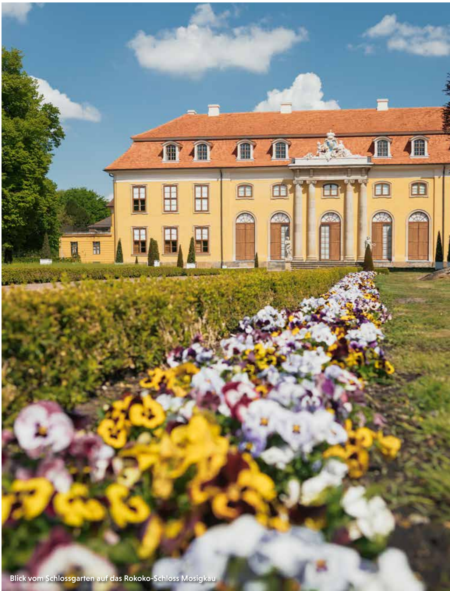
Blick vom Schlossgarten auf das Rokoko-Schloss Mosigkau