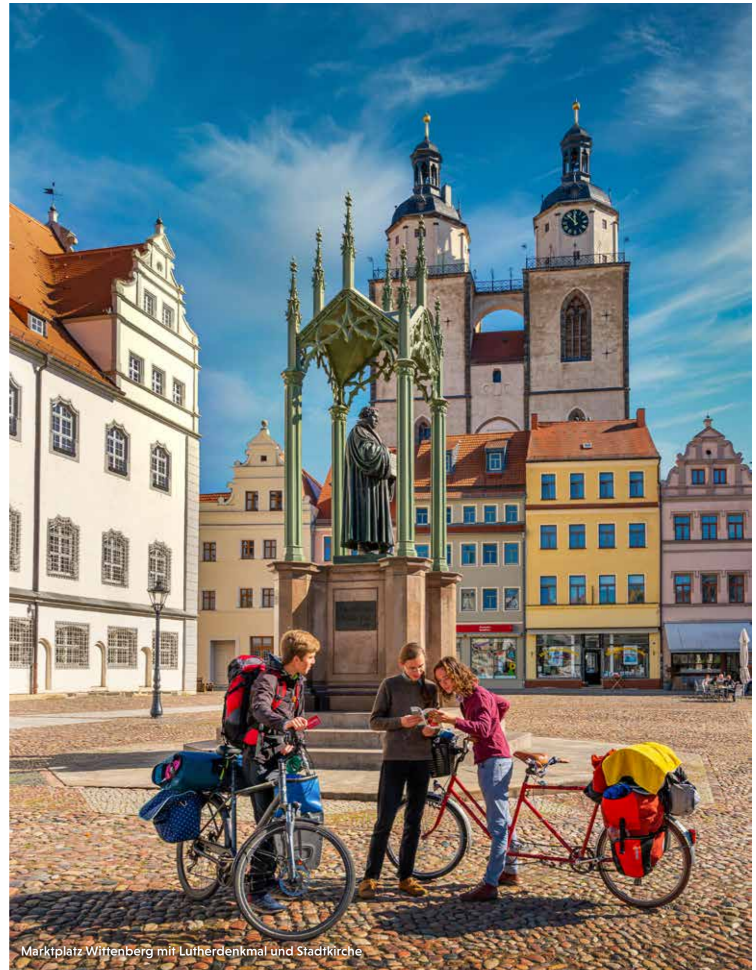
Marktplatz Wittenberg mit Lutherdenkmal und Stadtkirche