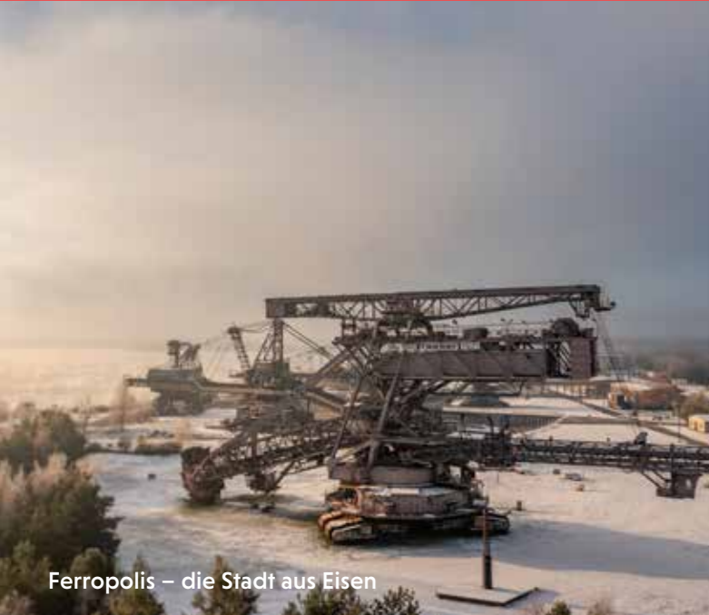
Ferropolis – die Stadt aus Eisen

Ob per Zeitreise ins Jahr 1517 im Asisi-Panorama oder an den Originalschauplätzen im historischen Stadtkern in den UNESCO-Welterbestätten Schlosskirche, Melanchthonhaus, Stadtkirche und Lutherhaus: Die Lutherstadt Wittenberg bietet viele Möglichkeiten, die Geschichte der Reformation zu entdecken.