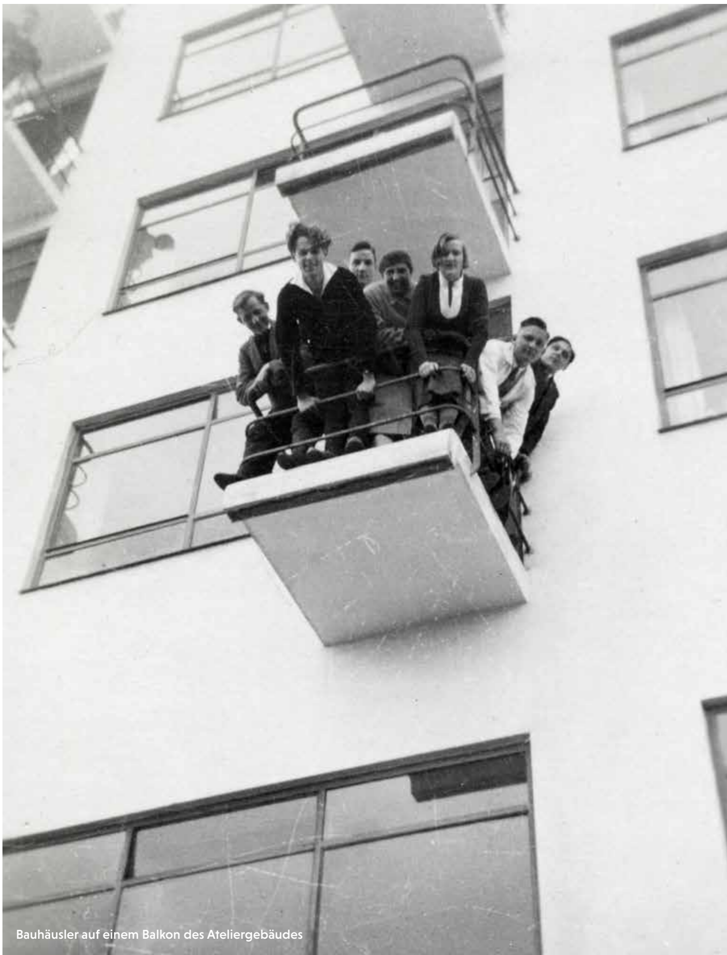
Bauhäusler auf einem Balkon des Ateliergebäudes