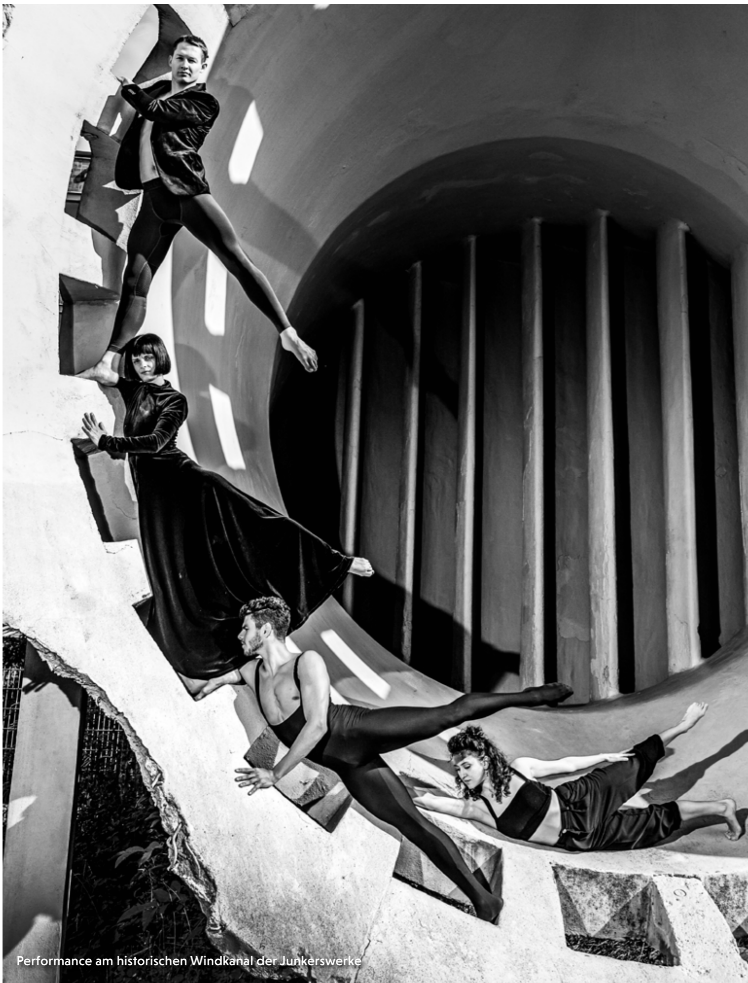
Performance am historischen Windkanal der Junkerswerke