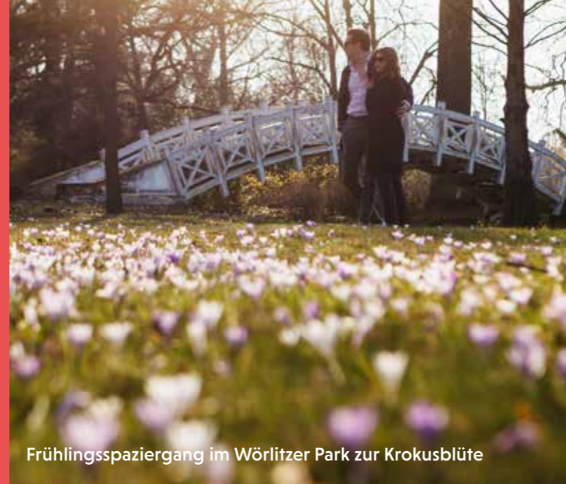
Frühlingsspaziergang im Wörlitzer Park zur Krokusblüte

Dessau liegt inmitten der WelterbeRegion Anhalt-Dessau-Wittenberg. In einem Radius von gut 30 Kilometer um die Stadt laden Naturparks, Städte mit reicher Historie und Zeugen vergangener industrieller Zeiten zum Entdecken und Verweilen ein.