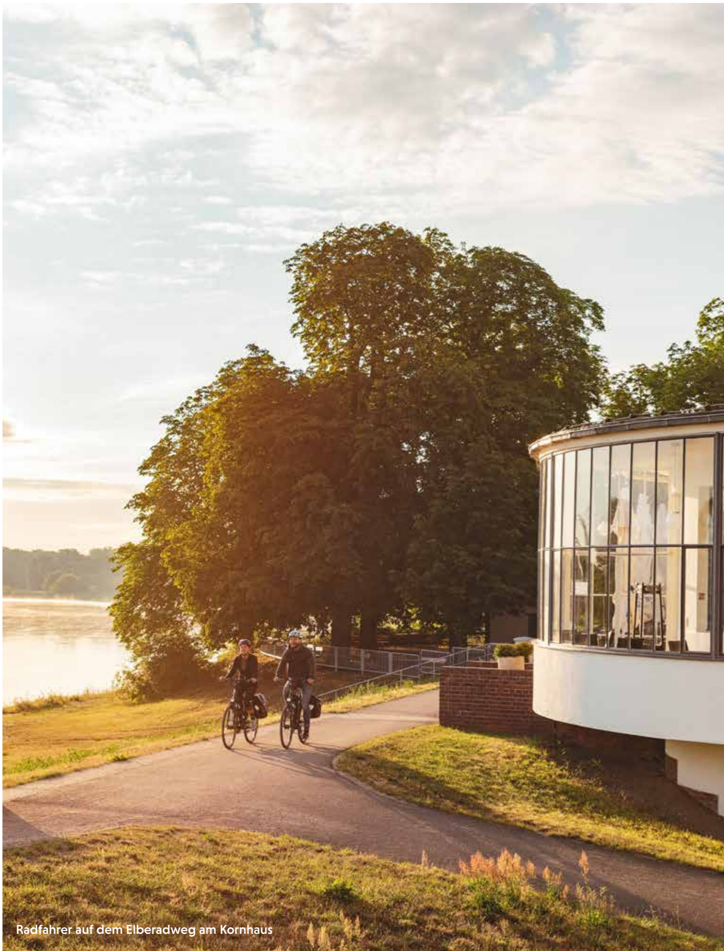
Radfahrer auf dem Elberadweg am Kornhaus